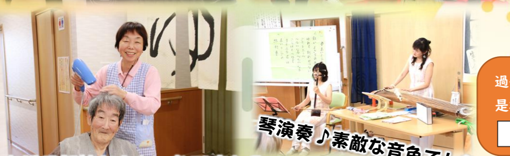
お風呂気持ちよかったですか？