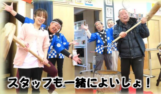
スタッフも一緒によいしょ！