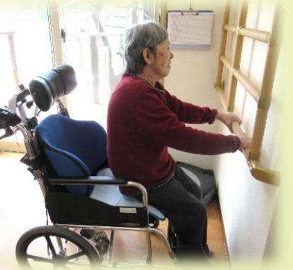
毎日ハッピー頑張っています!