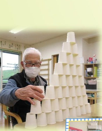
紙コップタワーに挑戦!

その方に合った、その方がやりたい！レクをご提供しています。一人で黙々と取り組む方、仲間とワイワイ楽しむ方様々です。毎日コツコツ!