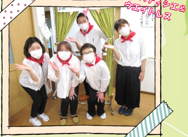
今回のパティシエ&ウエイトレス

その方に合った、その方がやりたい！レクをご提供しています。一人で黙々と取り組む方、仲間とワイワイ楽しむ方様々です。毎日コツコツ!