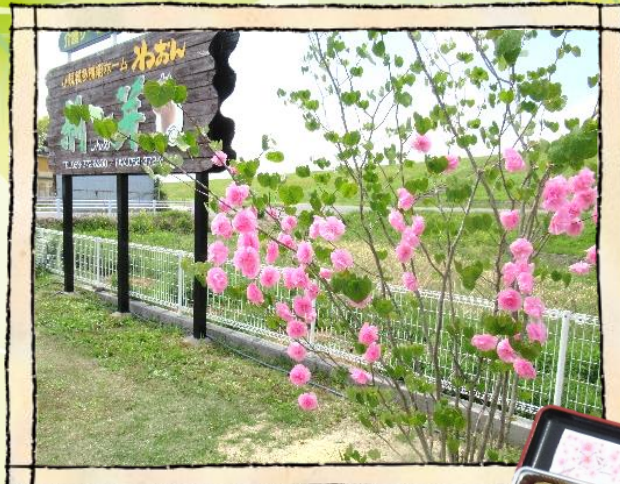
ご利用者様と作成した紙花を後に飾りつけました。

外の風にあたりお弁当を食べながら季節を感じて頂こうと今年も開きました『春のお花見弁当を味わおう』『外で食べるのも良いね』『美味しかった』と大変喜んでいただきました。