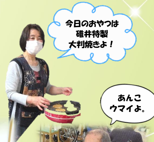
今日のおやつは碓井特製大判焼きよ!