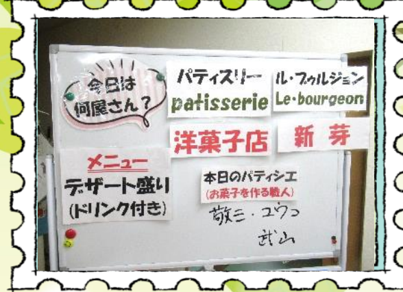
店名の説明からスタート！フランス語の勉強です。