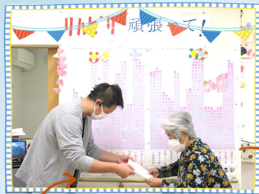
桜が沢山咲きました！