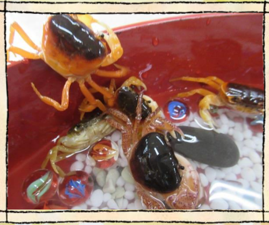
おおお 釣れたかな