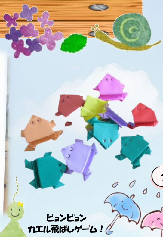
ピョンピョン カエル飛ばしゲーム！