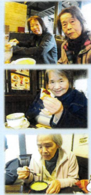
珈琲屋さんにお出かけしました

※掲載している写真の中に一時的にマスクを外している場面がありますが、撮影後はすぐに着用して頂いております。