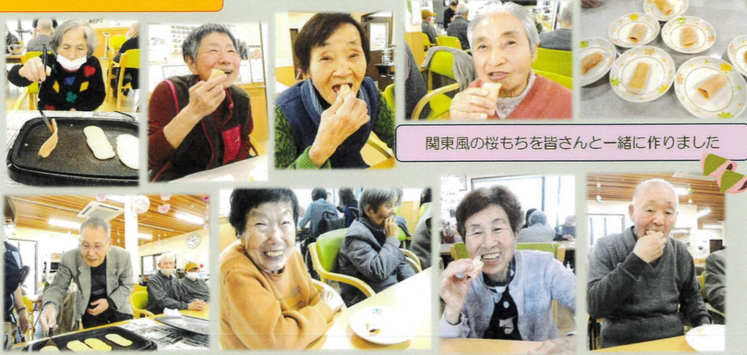
関東風の桜もちを皆さんと一緒に作りました

気候が良くなりましたので、つくしを採ったり、花々を見て、春を感じながら、お散歩をされました。